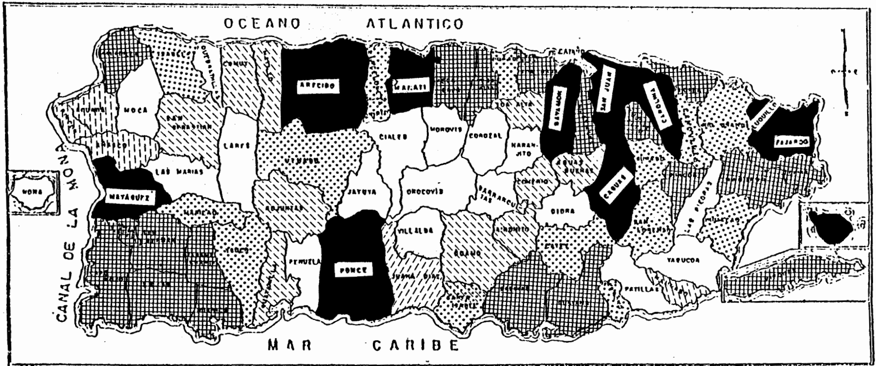
TASA DE PREVALENCIA POR 1,000