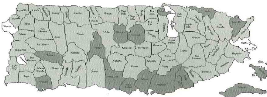
GRAFICO 2 PORCIENTO DE MADRES ADOLESCENTES POR MUNICIPIO PUERTO RICO, 1997

Un total de 4 municipios (Ceiba, Guaynabo, Hormigueros y Rincón) obtuvieron las cifras más bajas de madres adolescentes con valores de menos de un 15 por ciento. Por otro lado, un total de 16 pueblos (Arroyo, Cataño, Culebra, Guánica, Guay-