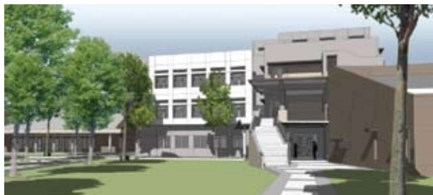
Museo de farmacia Dr. Luis Torres Díaz