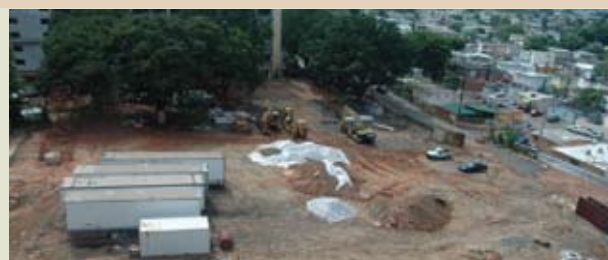
En septiembre 2008, comenzó la construcción del nuevo edificio de la Escuela de Farmacia. La estructura de tres pisos, que se ubicará en el solar en la foto, contará con oficinas, salones y laboratorios. El diseño estuvo a cargo del arquitecto Thomas Marvel de Marvel & Marchand Architect, LLP.