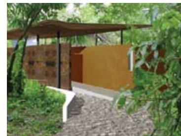
Jardín de Plantas Medicinales

El Museo de Farmacia Dr. Luís Torres Díaz, inaugurado en el 1954, alberga la colección más extensa de artefactos farmacéuticos expuesta en Puerto Rico y fue el primer museo establecido en una disciplina en ciencias de la salud dentro del sistema universitario.