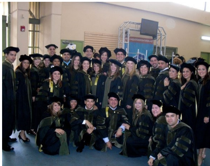
Clase Graduada 2010 en los Actos de Graduación el 4 de junio de 2010