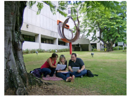
Edificio de la Escuela de Farmacia