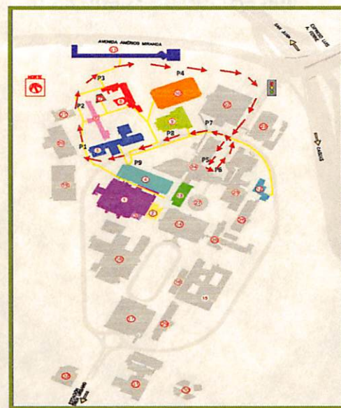
Mapa Ruta B

Parada 9: y Punto de Salida de la Ruta: Estacionamiento Bajo Techo, Adyacente al Edificio Dr. Guillermo Arbona