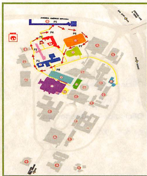
Mapa Ruta A

Parada 8 y Punto de Salida de la Ruta: Estacionamiento Bajo Techo, Adyacente al Edificio Dr. Guillermo Arbona