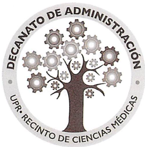
Versión en Español