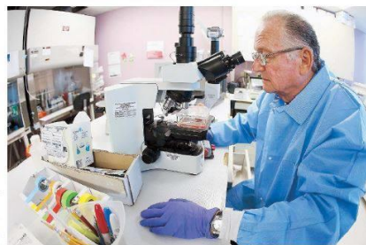
Investigadores del Recinto de Ciencias Médicas le dan seguimiento a estudios que comenzaron en la década del 90 y que exploran el impacto de partículas defectuosas del virus del sida en la propagación de ese mal.

"En su momento, pensamos (que) se podía utilizar como una vacuna potencial. La hipótesis que formulamos fue que esas partículas iban de alguna manera, e impedían el virus del sida en monos. Formulamos una hipótesis de que posiblemente en el semen de algunas personas hubiera una cantidad muy grande de partículas defectuosas que interfirieran con el virus del sida, que está también en el semen, no dejando que ese virus infecte", recordó