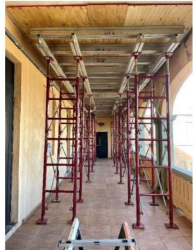
Edificio de Neurobiología San Juan