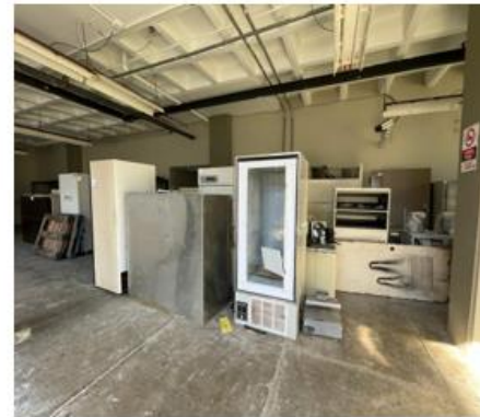
Antes de la Limpieza