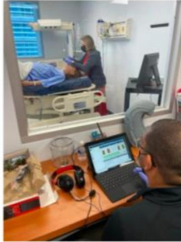
Facultad en preparación al comienzo del Programa doctoral en anestesia (DNP-SA) en junio 2022