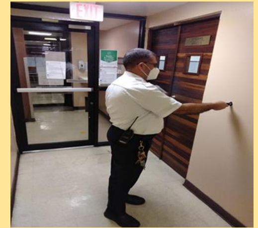
Guard Tour System