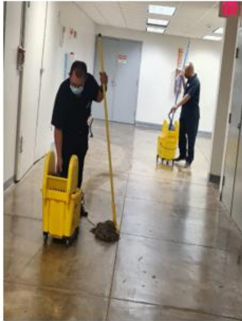
Sótano, Edificio Guillermo Arbona